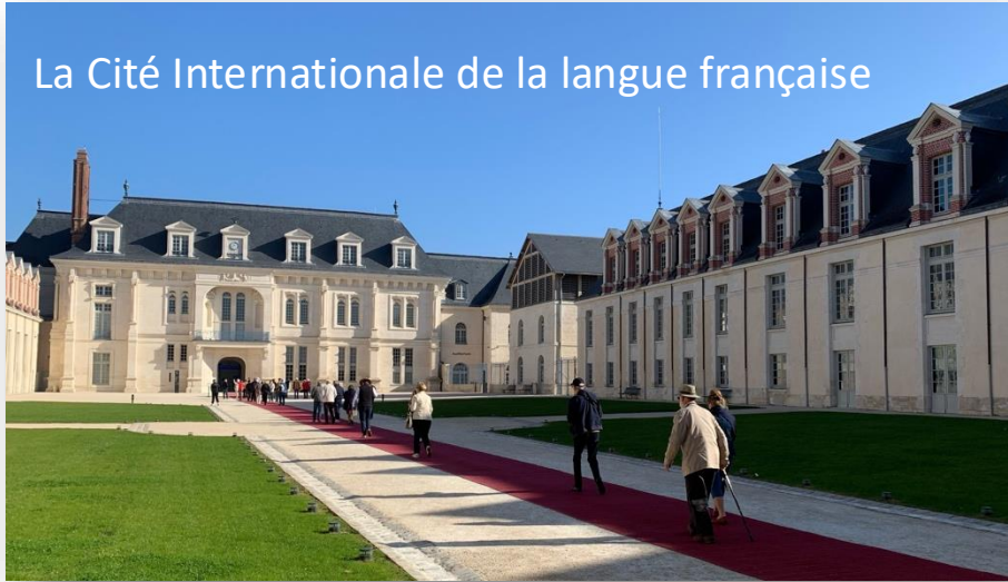
La Cité Internationale de la langue française