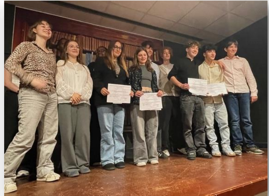
Lauréats et candidats

Le vendredi 23 mai 2025 , le lycée Saint Bénigne de Dijon a accueilli la finale de la 3ème session du concours de « Joutes oratoires » organisé par l'AMOPA 21. Le thème choisi pour cette session 2025 était :