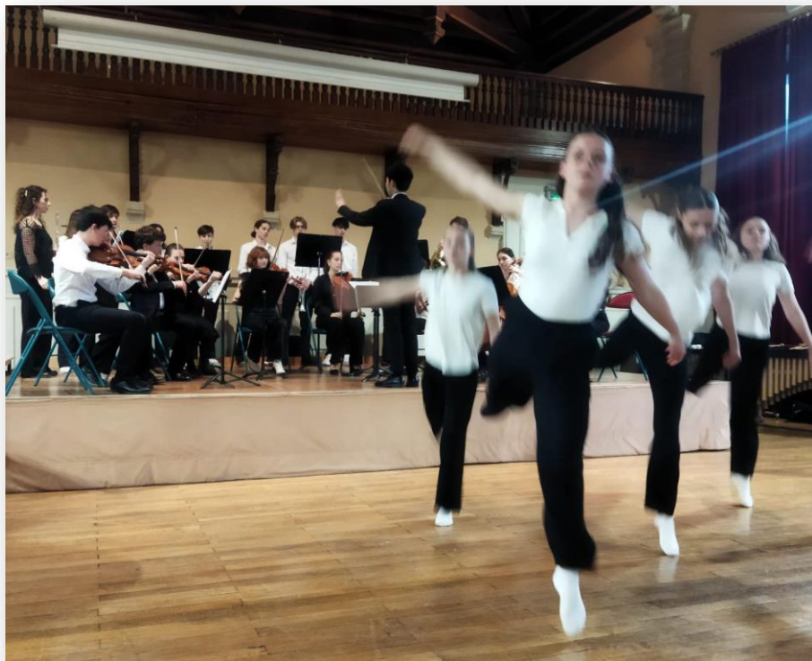
Ravel, Pavane pour infante défunte

Salle Roger Guillemain au lycée Carnot, 16 bd Thiers, 21000 Dijon suivi d'un moment de convivialité offert par l'AMOPA 21