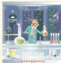
Microsoft Collection Clipart Word 2010